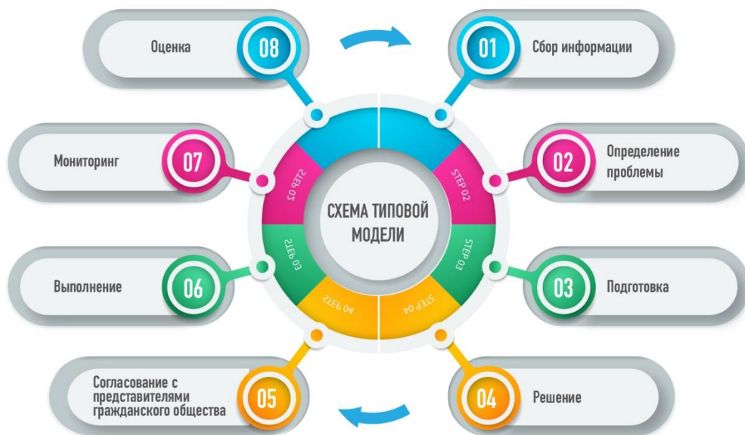
СХЕМА ТИПОВОЙ МОДЕЛИ